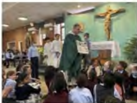
We kicked off the week with our Opening Mass on Sunday.

Catholic Schools Week is a joyful celebration of community, faith, and the gift of Catholic education! We've rounded up some of our favorite photos from the week to share with you: