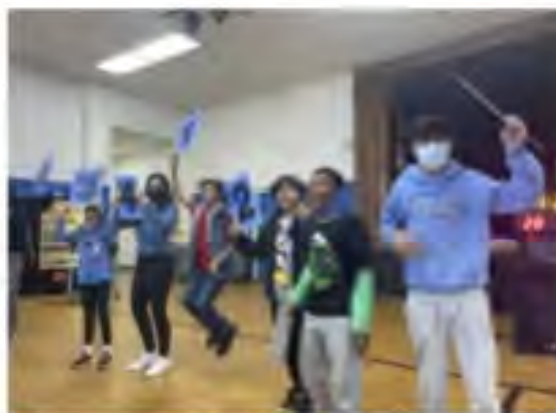
The Hollyrock Game Show is a Catholic Schools Week tradition. The Game Show combines Brain Challenge rounds and Physical Challenge rounds, and of course championship Simon Says. The kids of all ages go wild with excitement!