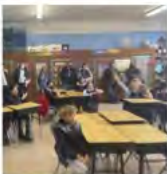
After Mass, we invited families to visit next year's classes for a preview.