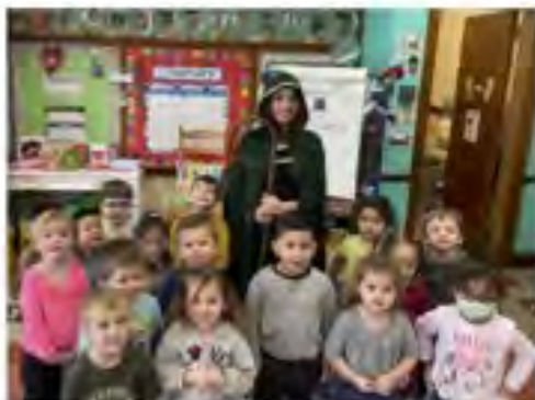
We celebrated Mass and had a visit from St. Brigid herself on her feast day.