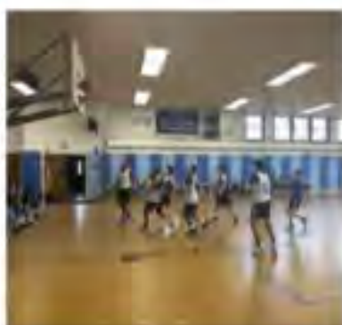
Our Pep Rally featured scrimmages with our Knights Basketball Team and Lady Knights Volleyball Team, as well as free throw challenges for everyone!